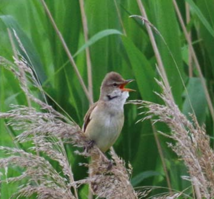
De Grote Karekiet bij de Berkel in Eibergen. Gevonden door Bart ter Beek. Deze foto ontving de redactie van Marina Pruysers voor plaatsing op Facebook maar deze staat ook mooi in het Zwaalfje!