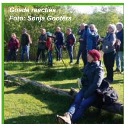
Goede reacties

Publieksexcursie Needse Achterveld, pagina 4