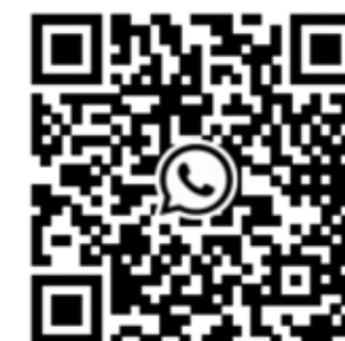
Deelnemen aan Whatsapp-groep "Vogelwerkgroep Berkelland"