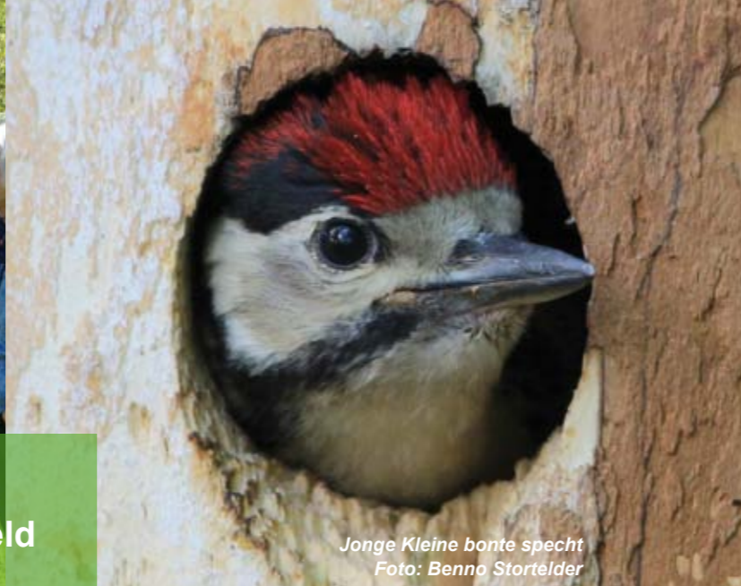
Jonge Kleine bonte specht