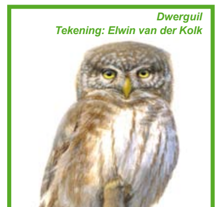
Dwerguil Tekening: Elwin van der Kolk